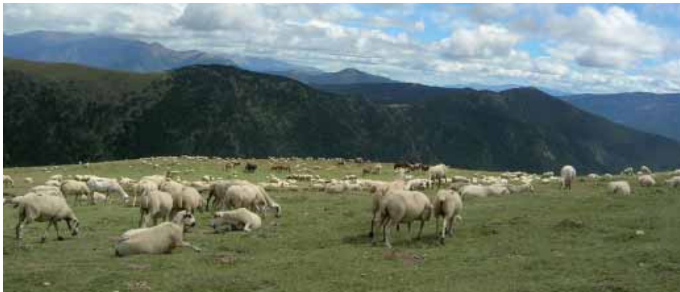
Foto: Ramat de xisquetes, compartint les pastures estivals de muntanya amb cavalls de carn (muntanya de Caregue).

ca de Qualitat (Q), per aquests xais, criats la major part de l'any amb pastures pirinenques, ajudaria a garantir la seva pròpia supervivència. Així mateix, l'obtenció, oferta homogènia i eficaç comercialització de genuïns productes d'aquestes comarques pirinenques, com pot ser, per exemple, l'anomenada "Girella del Pallars" –típic embotit, molt preuat però d'escassa difusió-, s'hauria de mirar de potenciar.