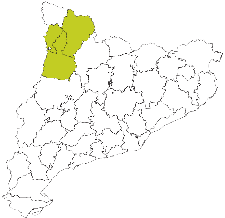
Figura: Les tres comarques originàries, i de major cens actual, d'ovella Xisqueta.

explotacions de l'any 2000 amb efectius de la raça, l'any 2003 n'hi havia ja tan sols 90, i l'any 2009 en restaven tan sols 72. És a dir, en el període analitzat havien tancat un 33,3% de les explotacions. Quant al nombre d'efectius, lògicament, la davallada ha anat paral·lela; un 36,7% menys amb respecte a l'any 2000. Aquestes dades són congruents amb els percentatges de relleu generacional argüïts pels propis ramaders. Fent una estimació conjunta del període, el relleu garantit no supera el 20% de les explotacions. La resta ja han manifestat la no continuïtat o els seus dubtes seriosos en aquest sentit. Una altra dada important és que, dels actuals ramaders en actiu, un 67% ha reduït el cens del seu ramat. Dels actuals 72 ramaders de l'estudi, el 75% pertany a l'associació ACOXI. Quant a la transhumància, s'ha mantingut en uns percentatges semblants la d'estiu (62% l'any 2000 vs 67% l'any 2009), havent baixat significativament la d'hivern (20% l'any 2000 vs 11% l'any 2009).