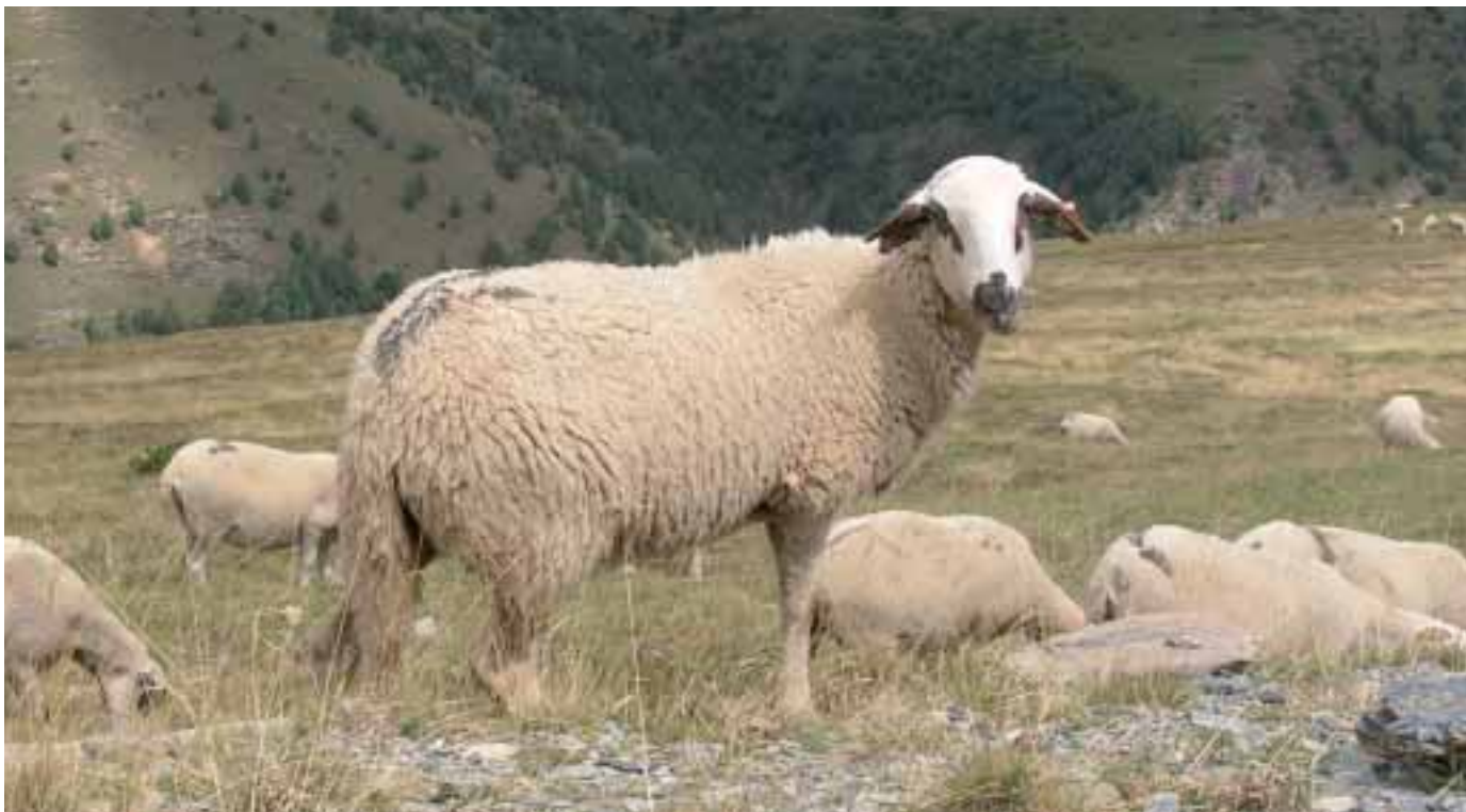
Foto: Ovella Xisqueta amb les característiques típiques del tronc ibèric, del qual descendeix.