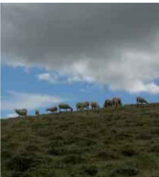
Foto: Molt rústega i gran caminadora, amb una capacitat de pasturatge molt desenvolupada, aprofita de forma òptima les pastures fibroses, fins i tot sota la neu. Autor: Jordi Jordana

La raça Xisqueta pertany al Tronc Ibèric, i podem situar els seus nuclis originaris a la Vall de Manyanet i la Vall Fosca.