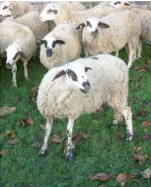
Foto: Les degradacions en negre al voltant dels ulls, orelles, morro i part distal de les extremitats, són els signes morfològics més típics de la raça. Autor: Jordi Jordana