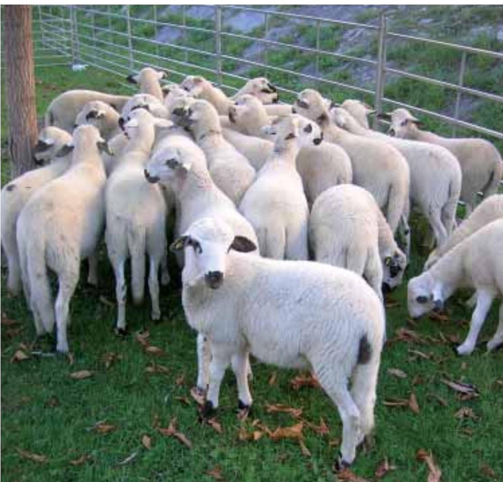
Foto: L'obtenció d'un producte uniforme i de qualitat, del corder o xai d'aquests indrets, és la principal activitat econòmica dels ramaders. Autor: Jordi Jordana

racteritzant, estudiant i pautant la uniformització de la raça; aprovant el seu prototip o estàndard racial i reglamentant-ne el Llibre Genealògic. La programació dels aparellaments més òptims –des del punt de vista genètic, mitjançant marcadors moleculars–, entre les diferents valls i explotacions, ha d'ajudar a continuar mantenint la màxima diversitat genètica possible amb el mínim increment de consanguinitat per generació. L'elecció, amb criteris genètics, de marrans representatius de la raça per a la conservació criogènica de dosis seminals, i el pla d'eradicació dels animals amb haplotips susceptibles a l'Scrapie (tremolor ovina), són altres dues importants tasques del programa de la raça. La redacció i proposta d'un pla de millora, encarat fonamentalment vers la producció d'un xai de qualitat que pugui competir amb força en el mercat comercial de les bones taules, és l'objectiu essencial i primordial a mitjà termini. La bona gestió del Llibre Genealògic ha de contribuir de forma bàsica a assolir aquest objectiu. L'obtenció d'una Denominació d'Origen (DOP), Indicació Geogràfica Protegida (IGP) o una Mar-