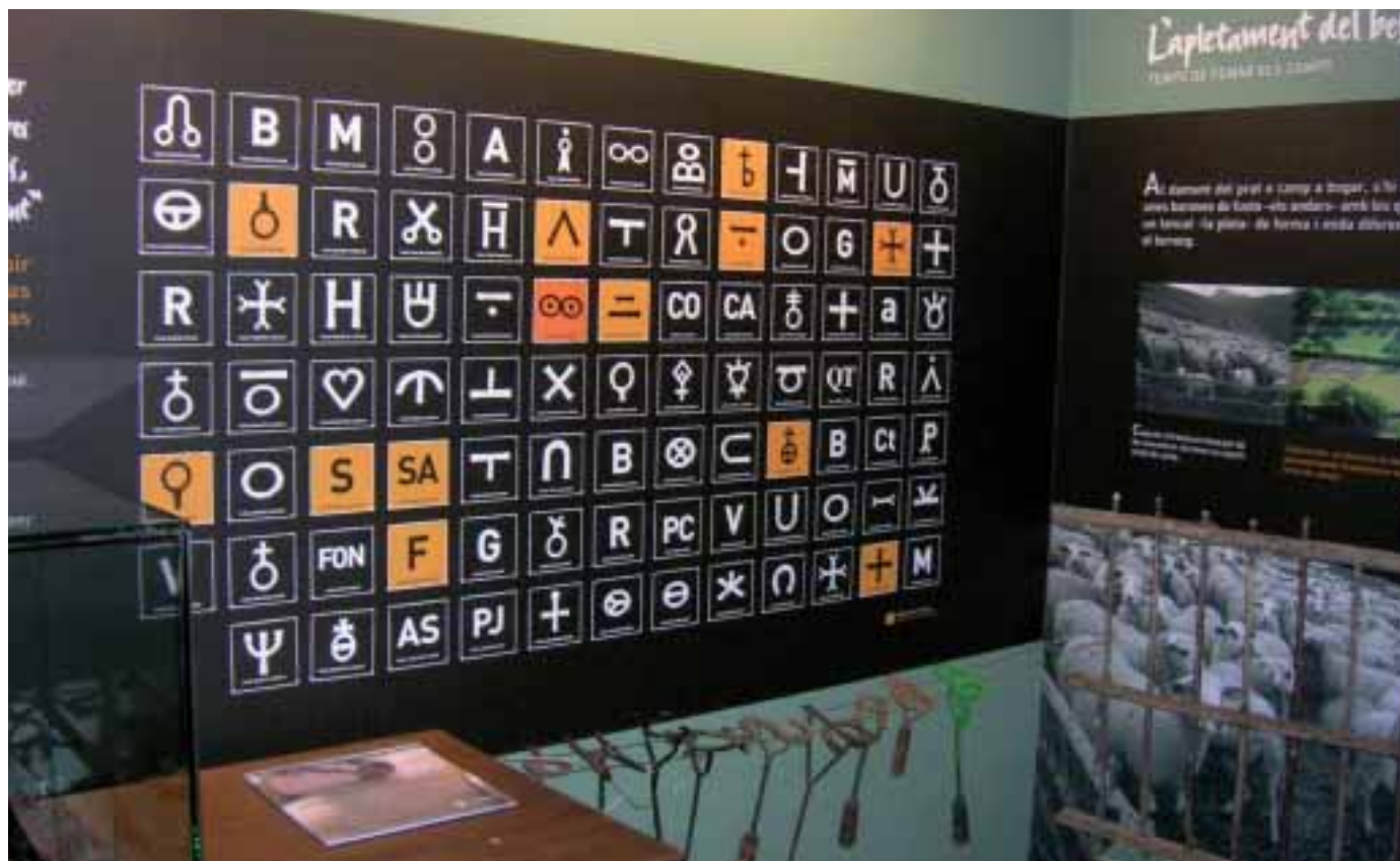
Foto: Marques de Ramat (antany de pega escalfada; actualment, les poques que resten, de pintura) de la vall d'Àssua (Pallars Sobirà), en el Museu del Pastor de Llessui. Autor: Jordi Jordana