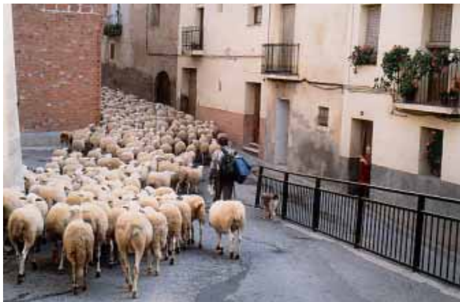
Foto: Tot i que la trashumància d'hivern, cap a les planes de Lleida i voltants, es va perdent paulatinament, encara queden alguns ramats, sobretot a l'Alta Ribagorça, que la continuen practicant.

La Xisqueta, una raça "ullerada" que sempre cria un bon corder.