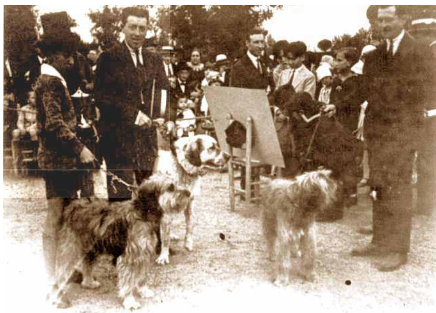
Foto: L'any 1929, a partir dels gossos "Tac" i "Iris", guanyadors de la VII Exposició Canina Internacional de Barcelona, es redacta el primer estàndard oficial de la raça. El Gos d'Atura Català passa a ser la primera raça autòctona de l'Estat, reconeguda oficialment i internacionalment. Autor: Club del Gos d'Atura Català. Jordi Carulla.

Presenta una gran varietat de pelatges, essent el més característic el de color canyella en diferents gammes.