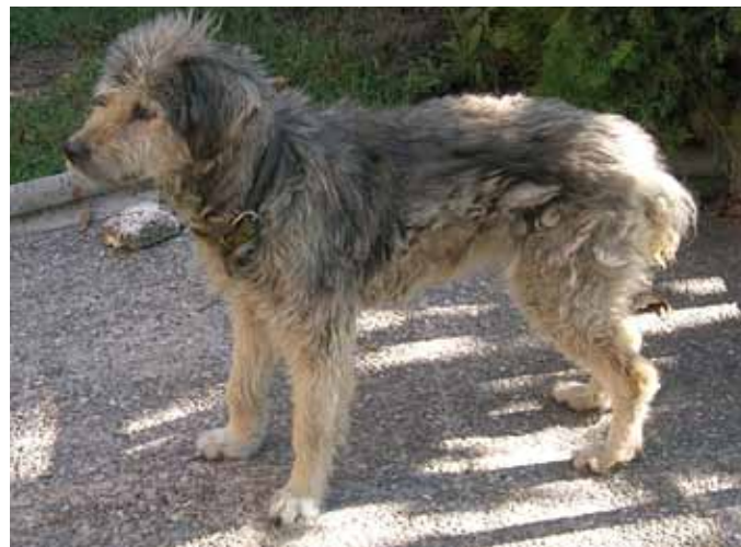
Foto: Gos d'Atura de la varietat de pèl curt, talment anomenat Cerdà. Autor: Jordi Jordana.

Al cap presenta barba, bigoti, tupè i celles. Les orelles són d'inserció alta, triangulars, fines i acabades en punta i caigudes. L' stop (depressió frontonasal) és ben visible, però no gaire pronunciat. El morro té forma de piràmide truncada i la trufa (nas) negra. Els llavis i el paladar també estan intensament pigmentats de negre.