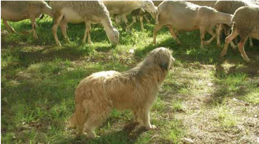
Foto: El Gos d'Atura és un perfecte animal de companyia, però encara millor company de feina.