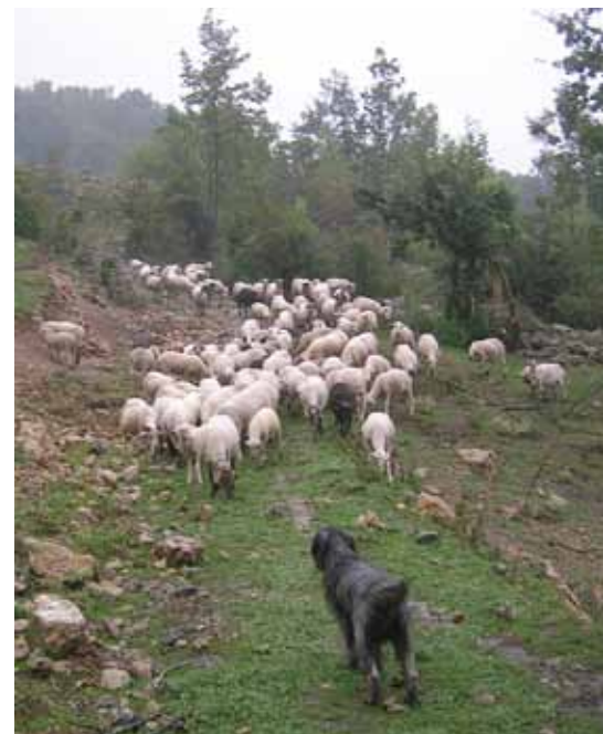
Foto: "Ovella, vine aquí". Gos d'Atura sempre atent i vigilant del seu ramat. Autor: Jordi Jordana.

El Gos d'Atura Català és un perfecte animal de companyia i un excel·lent conductor de ramats.