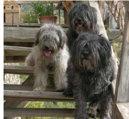
Foto: El Gos d'Atura presenta un ampli ventall de pelatges, a quin més vistós. Autor: Jordi Jordana

Montgrí, Campllong, Castellterçol o Gallecs, per posar només alguns exemples. Tampoc no hem d'oblidar els diferents concursos morfològics i de bellesa que es realitzen, de forma sistemàtica, en diferents poblacions de Catalunya i que contribueixen a la seva divulgació i promoció.