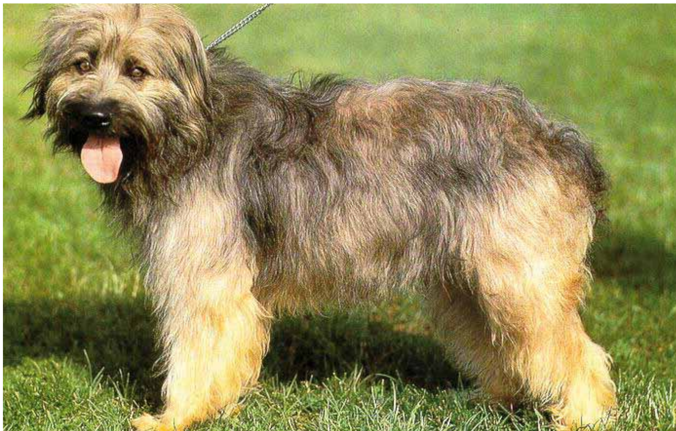
Foto: Esplèndid i típic exemplar de Gos d'Atura, on es pot observar la característica trufa negra i la marcada depressió frontonasal (stop).