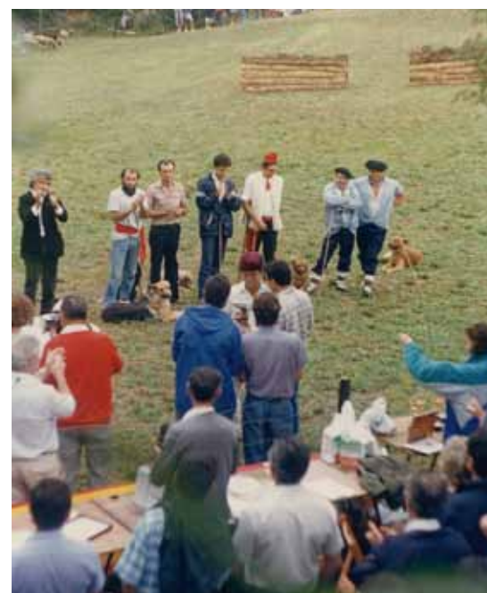
Foto: Els concursos de treball han donat a conèixer les grans qualitats d'aquest gos al gran públic. Primera edició del concurs celebrat l'any 1987 a Llavorsí (Pallars Sobirà), amb pastors vinçuts de diferents contrades. Autor: Jordi Jordana.