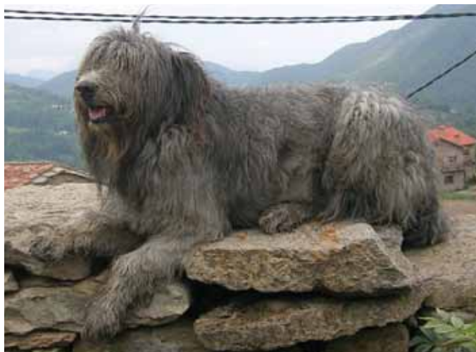
Foto: Descansant, després d'una àrdua jornada de treball.