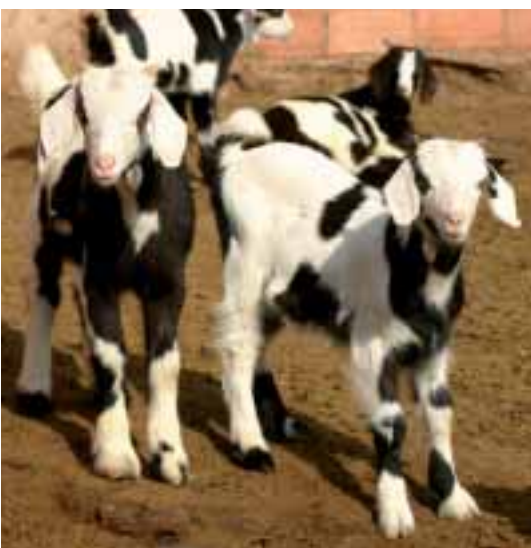
Foto: Un cabrit de qualitat, amb un pes viu de 7 a 10 kg, és la principal orientació productiva d'aquesta raça. Autors: Jordi Jordana i Sergi Camé

CARNÉ, S. (2005). La Cabra Blanca de Rasquera: caracterització estructural de les explotacions i estudi morfològic de la raça. Tesina d'Investigació. Universitat Autònoma de Barcelona, Barcelona.