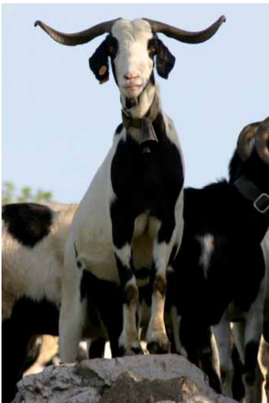
Foto: Magnífic i elegant exemplar de Cabra Blanca de Rasquera. Autors: Jordi Jordana i Sergi Carné

El pelatge predominant és el clapat de negre sobre fons blanc (70% dels individus), seguida