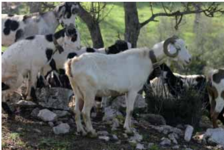
Foto: Encara que el pelatge predominant és el clapat de negre, la totalment blanca continua mantenint un elevat percentatge en la raça. Autors: Jordi Jordana i Sergi Carné

major part de l'any, amb l'aprofitament de les pastures forestals de serra.