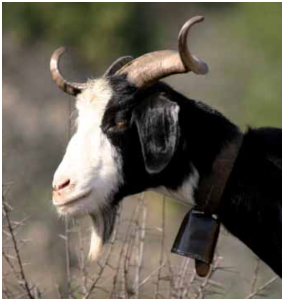
Foto: Cap de Cabra Blanca. La pera o masclet (floc de pèls que creixen al mentó) és sempre present i ben desenvolupada en els bocs, i més discreta o absent en les femelles. Autors: Jordi Jordana i Sergi Camé

CARNÉ, S., ROIG, N., JORDANA J. (2007). "La Cabra Blanca de Rasquera: Caracterización estructural de las explotaciones". Archivos de Zootecnia, 56: 43-54.