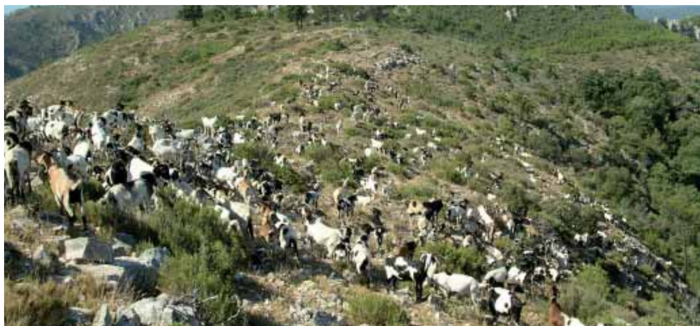
Foto: Els ramats de cabres realitzen una gran tasca en el manteniment del paisatge i la prevenció d'incendis forestals.

Denominació d'Origen i/o Marca de Qualitat que comportés un valor econòmic afegit al cabrit, hauria d'ésser també objectiu prioritari, i, així doncs, la pròpia qualitat del producte podria emparar la pròpia preservació de la raça. No ens hem d'oblidar, ni molt menys, d'un altre producte d'interès, d'elaboració artesana, antiga i molt tradicional en aquestes comarques, i que ha tornat a ressorgir en els darrers anys potenciant la gastronomia turística