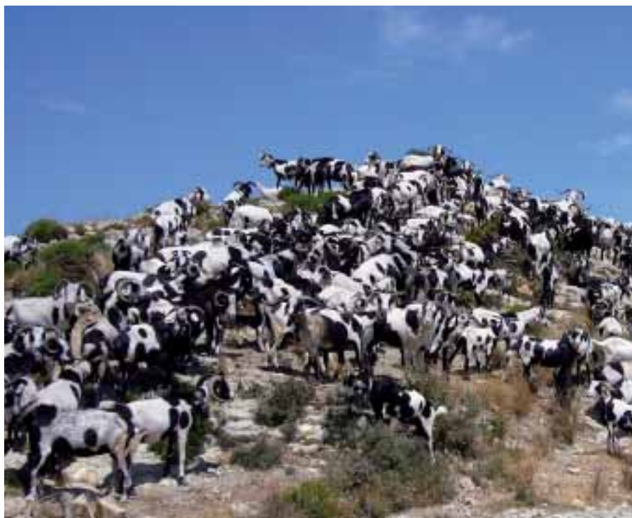
Foto: Ramat de Cabra Blanca de Rasquera amb una gran varietat policroma. Autora: Montserrat Vicilla

Però el més important de tot és que s'ha aconseguit, o s'està a un pas d'aconseguir-ho –manquen tan sols uns darrers serrells legals–, la creació, per aquest any 2010, de l'associació de ramaders de la raça, tasca feixuga i meritòria en la qual hi han tingut molt a veure l'Oficina Comarcal del DAR de la Ribera d'Ebre i l'Ajuntament de la vila de Rasquera. Aquest, veritablement, ha estat el pas més important de la raça vers la seva recuperació.