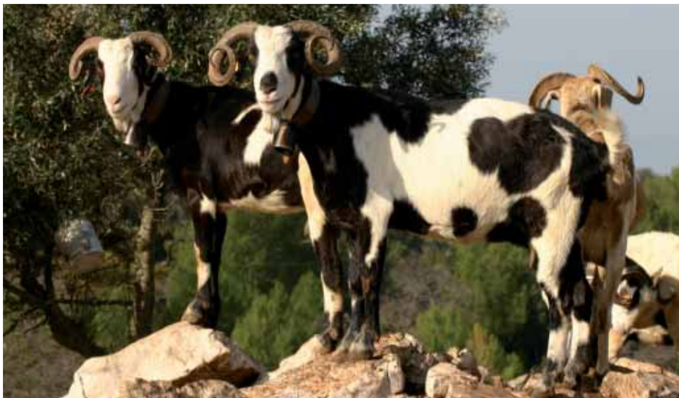
Foto: La Cabra Blanca de Rasquera presenta una gran varietat en la forma del banyam, predominant, però, les de tirabuixó i cargolades. Autors: Jordi Jordana i Sergi Carné

El suport i ajut mostrats cap a la raça per part del DAR de la Generalitat de Catalunya, al promoure i finançar els estudis corresponents en aquesta població, a través de la Facultat de Veterinària de Barcelona, han estat decisius. No està massa bé el dir-ho –ja que en som part implicada–, però en aquests anys se l'ha caracteritzat, entroncat filogenèticament i s'ha pautat la seva uniformització; estant a hores d'ara en disponibilitat de poder presentar una proposta ferma d'estàndard racial, de cara a reglamentar el seu futur Llibre Genealògic. Els estudis genètics portats a terme han permès donar les recomanacions més adients per