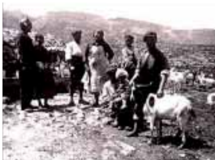
Foto: Ramat de cabres blanques (CBR) a la Muntanya de Llens (Rasquera), cap al 1938.