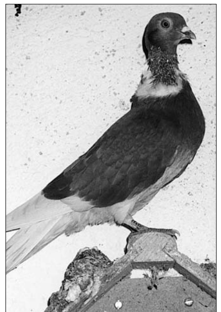
El colom coll pelat és un dels vuit coloms de Catalunya que encara es conserven. Pere-Miquel Parés i Casanova.

- Desastres naturals i malalties. Tenim els casos recents de la BSE ("vaques boges") i de la grip aviària.