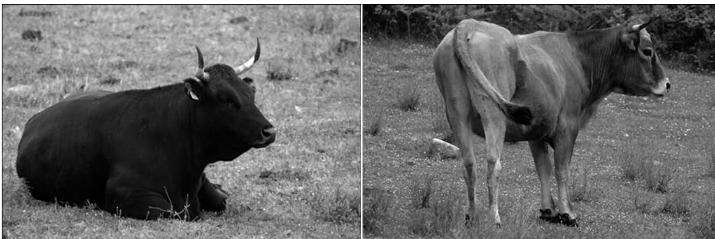
Dues de les varietats de la mateixa raça alberesa, típica de la serra de les Alberes, a l'Alt Empordà (Girona). Pere-Miquel Parés i Casanova.

Uns bons exemples són la vaca alberesa i la cabra blanca de Rasquera, races capaces d'aprofitar recursos vegetals molt pobres. Ara bé, és important adonar-se d'un fet que sovint ha generat massa tòpic sobre aquesta elevada rusticitat de les races autòctones. Una cosa són els marges de tolerància d'una raça, i l'altra, els marges òptims de producció. Ésser capaç de viure a temperatures nocturnes inferiors als 0°C (és el cas del cavall bretó cerdà) no vol dir fer-ho amb igual eficàcia que a 20°C. Això vol dir que una raça susceptible de viure en un