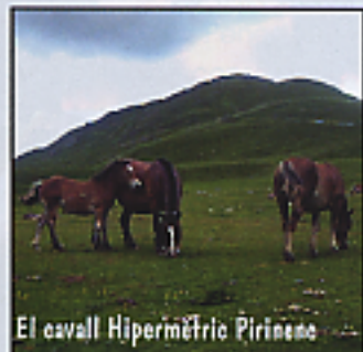
El cavall Hipermètric Pirineu