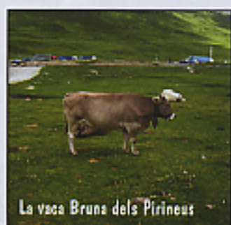
La vaca Bruna dels Pirineus