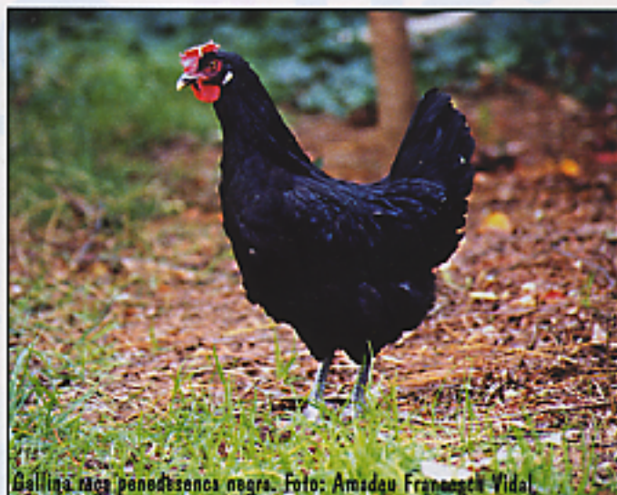
Gallina raça penedesenca negra.