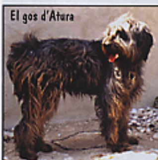
El gos d'Atura

La raça es troba en expansió. Es cria gairebé per totes les comunitats autònomes espanyoles, així com a Alemanya, Holanda, França, Anglaterra i els Estats Units.