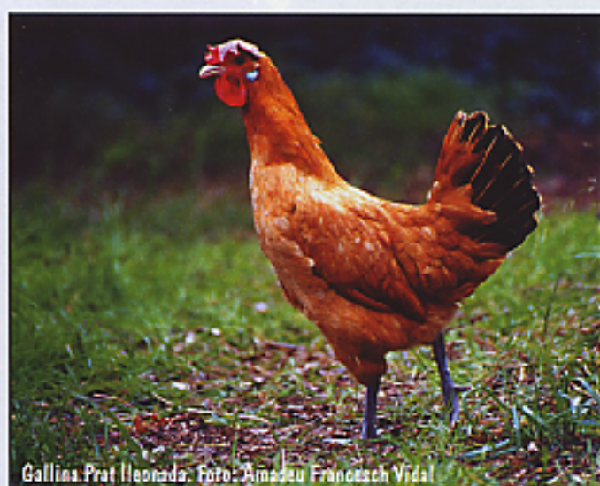
Gallina Prat Lleonada.