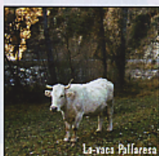
La vaca Pallaresa