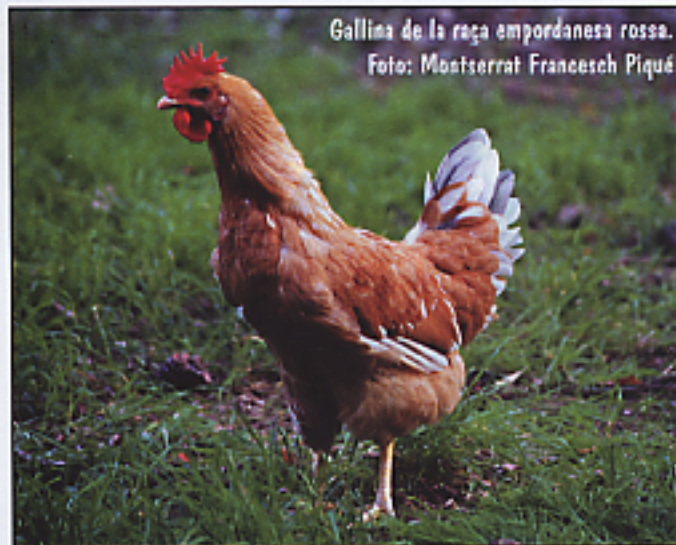
Gallina de la raça empordanesa rossa.

ma de millora genètica de la varietat roja, enfocada a obtenir un pollastre més rendible cap a una producció de carn de tipus tradicional, els objectius del qual s'han assolit.