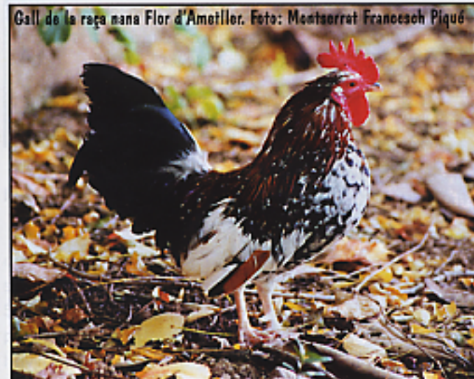
Gall de la raça nana Flor d'Ametller.

La gallina Empordanesa, com la Penedesenca, també es troba en expansió. Es cria per tot Espanya i també a Alemanya, Holanda i França.