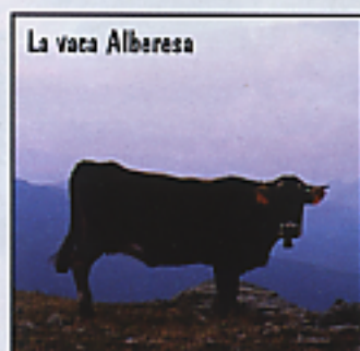
La vaca Alberesa

En aquesta pàgina i en la número 8, estan fotografiats tots els animals de pàl i llana autòctons de Catalunya que els amtelxos autors d'aquest article sobre l'aviram i els coloms van descriure en el n°36 d'Entre camps i animals.