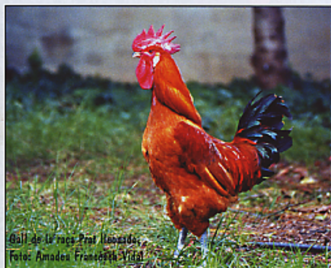
Gall de la raça Prat Lleonada.

A Catalunya, fa anys, existien més animals autòctons com el porc català (també anomenat de Vic), la vaca Marinera i la Cerdana, que han desaparegut. Els animals de pèl i de llana que avui existeixen a Catalunya estan, en general, en perill d'extinció, menys el gos d'atura.