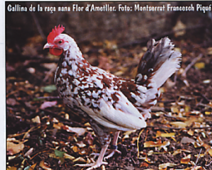
Gallina de la raça nana Flor d'Ametller.

800 g i el gall 1.100. De tarsos predominantment blancs i les orelletes blanques. Pon uns ous amb un pes al voltant dels 38 g. Destaca, i ha estat sempre apreciada, per les seves bones aptituds maternes, tant vers els propis ous i pollets com cap els d'altres aus. Actualment, AVIRAUT, que és una entitat que, coordinada amb l'IRTA també treballa amb les altres races de gallines catalanes, així com amb l'oca empordanesa, està treballant per a la definició d'aquesta raça, per a la qual cosa n'ha elaborat un primer patró.