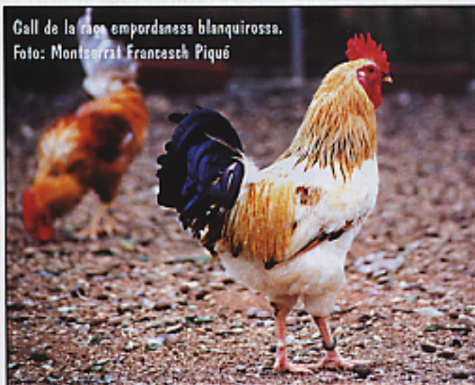
Gall de la raça empordanesa blanquirossa.