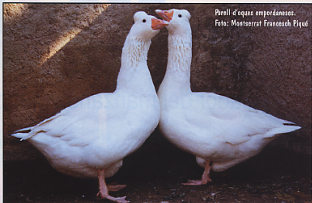
Parell d'oques empordaneses.

Un dels trets diferencials d'aquesta raça, respecte a d'altres races d'oques, és la particular presència del monyo, ja que es tracta de l'única raça d'oques, a nivell mundial, que ostenta aquesta característica. Les primeres cites que tenim d'aquestes oques daten de finals del s.XIX, moment en el qual encara se les coneixia com a «oques del país» o «blanques comunes», molt habituals a Girona i Barcelona. Al 1928 ja es presentaven amb monyo a les exposicions. La part de Catalunya en què eren més apreciades era l'Empordà, on la seva carn era molt