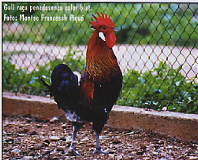
Gall raça penedesenca color blat.