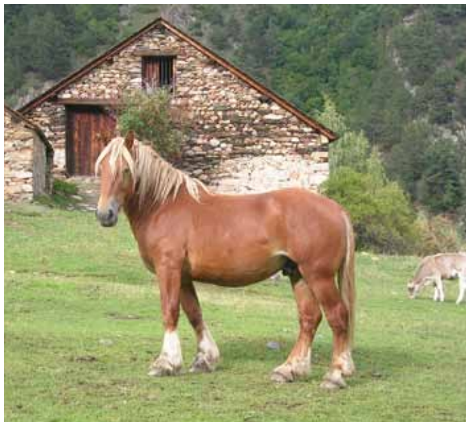
Foto: Excel·lent prototip de Cavall Pirinenc Català, pasturant per la zona d'Alòs d'Isil (Pallars Sobirà).