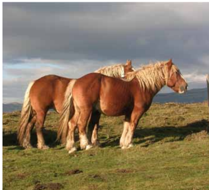
Foto: A la muntanya d'Espinavell (Ripollès), hi podem trobar magnífics exemplars representatius de la raça. Autor: Jordi Jordana.