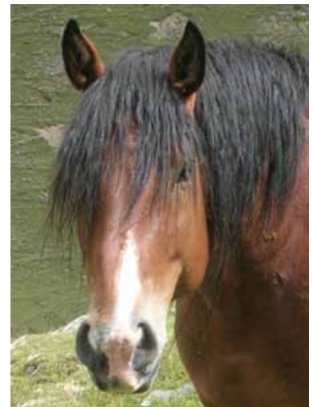
Foto: Euga castanya, d'amples narius, amb perfil i frontonasal subconvex. Orelles mòbils de grandària mitjana amb puntes arrodonides i vorera externa moderadament arquejada. Cara molt expressiva i relativament llarga. Autor: Jordi Jordana.

El Cavall Pirinenc Català té els seus orígens en l'antic Cavall Català, raça de tir lleuger extingida a mitjan el segle XX.