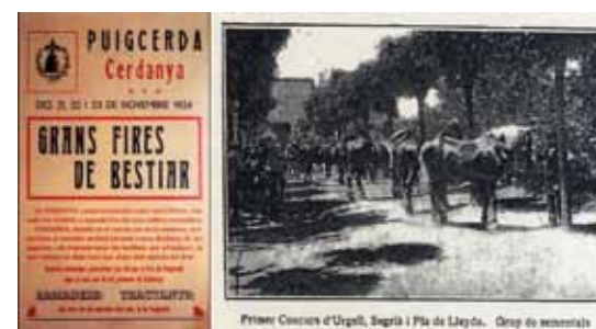
Foto: Les fires i concursos de bestiar equí proliferaren per tot Catalunya a partir del primer terç del segle XX, com les de Puigcerdà, Salàs de Pallars, Organyà i Verdú, així com els concursos de Figueres, La Bisbal, Tortosa, Puigcerdà i Lleida, com a més importants. Autor: Servei de Ramaderia, Mancomunitat de Catalunya, 1922.

Tres comarques: Cerdanya, Pallars Sobirà i Ripollès, concentren més dels dos terços del cens i criadors de la raça.