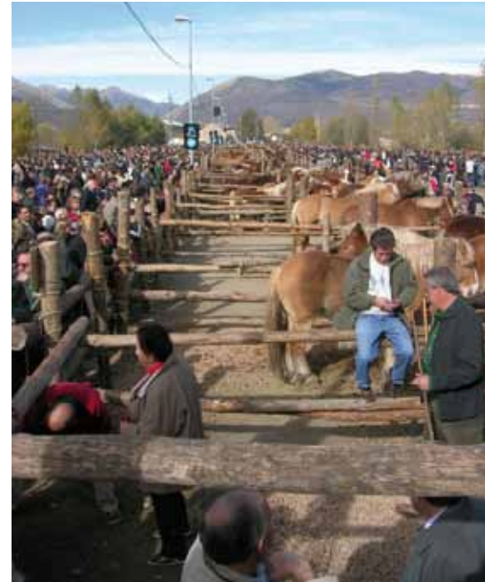
Foto: La Fira de Puigcerdà, que data de l'any 1182 —per una concessió reial del rei Alfons I—, continua essent la més important dels Pirineus i una de les primeres d'Espanya. Autor: Jordi Jordana.

La bona i eficaç gestió —per part de tots— del Llibre Genealògic de la raça ha d'ésser el suport i pilar bàsic que apuntali l'eficient posada a