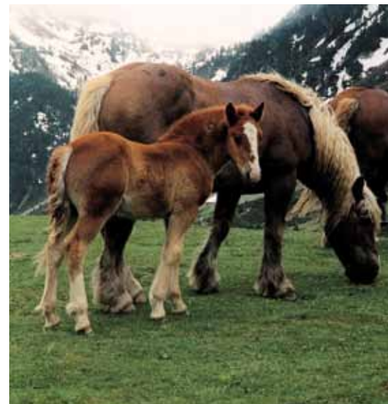
Foto: El Cavall Pirinenc Català té una gran facilitat de part i notables aptituds maternes per a la cria. Port de la Bonaigua (Pallars Sobirà). Autor: Pere-Miquel Parés.