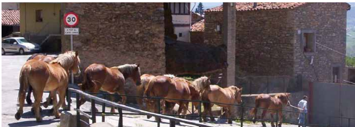
Foto: Lot molt uniforme, amb un bon desenvolupament muscular, camí dels corrals, en un poble de Cerdanya. Autors: Jordi Jordana i John Infante.

punt del Programa de Selecció i Millora Genètica. Aquest anirà orientat, principalment, a la millora de les aptituds maternals i càrnies de la raça, amb l'objectiu últim de produir un pollí per a carn de qualitat i bon creixement.