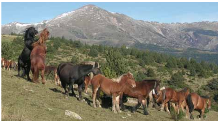
Foto: Eugassada, baixant a trot, cap a la Trià dels Mulats d'Espinavell (Ripollès).

Durant el període 2004-2005 s'inicien les converses per regularitzar el sector i pautar així la uniformització de la població i els seus productes, rebutjant i impeding els encreuaments indiscriminats amb altres races, per mirar de